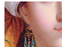
VOCES BARROCAS de Naïve: 10 nuevos títulos

I hope you will enjoy listening to this recording as much as we enjoyed making it.